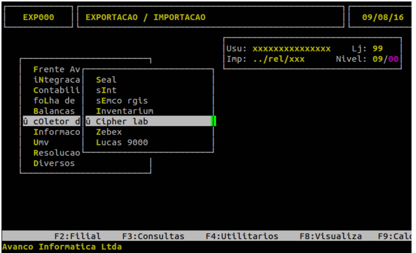
Tela de Exportação